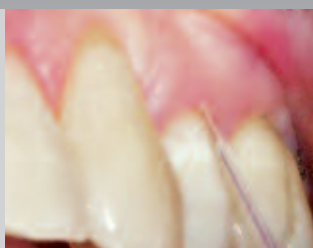
Обработка пародонтальных карманов