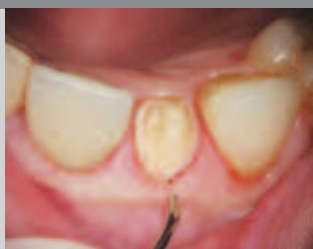
Подготовка для слепков